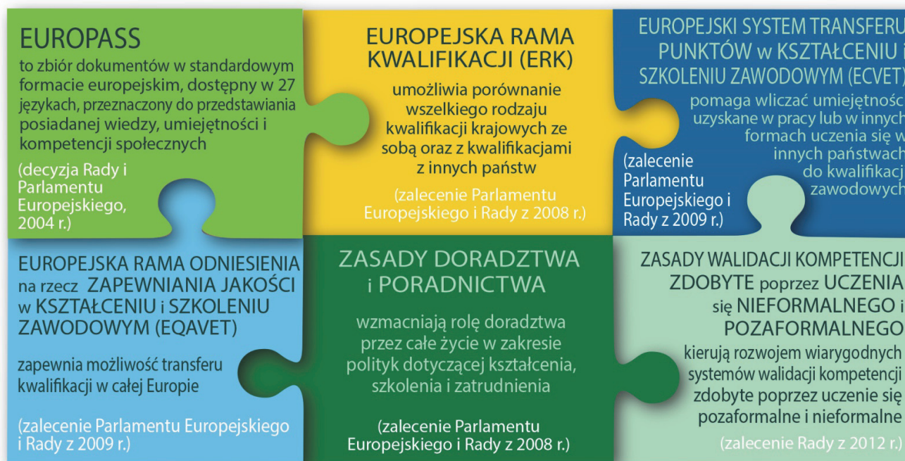
Rys 1. WSPÓLNE EUROPEJSKIE NARZĘDZIA I ZASADY

poprzez podkreślenie znaczących osiągnięć dotychczasowej współpracy europejskiej w tym zakresie. Drugie wydarzenie zostało zorganizowane w listopadzie 2015 r. w Brukseli wspólnie z fundacją Europejską Fundacją na rzecz poprawy warunków życia i pracy (Eurofound) z Dublina (również obchodzącą 40. Rocznicę utworzenia) oraz Europejskim Komitetem Ekonomiczno-Społecznym (EKES). Spotkanie to stanowiło przypomnienie głównej roli partnerów społecznych oraz EKES przy tworzeniu obu agencji. Podkreślono również istotne znaczenie dialogu społecznego dla tworzenia warunków pracy i nauki sprzyjających rozwojowi umiejętności, zwiększaniu wydajności i pobudzaniu innowacji.