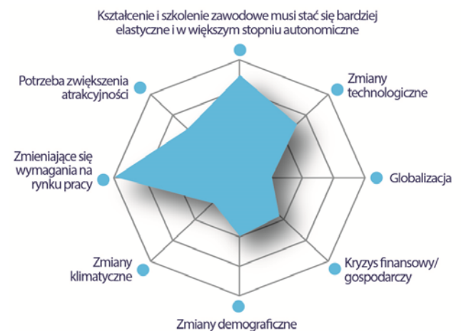
Wykres 1. Powody najnowszych inicjatyw innowacyjnych w zakresie kształcenia i szkolenia zawodowego, EU+, 2014 r.

Źródło: Cedefop na podstawie przykładów dostarczonych przez ReferNet.