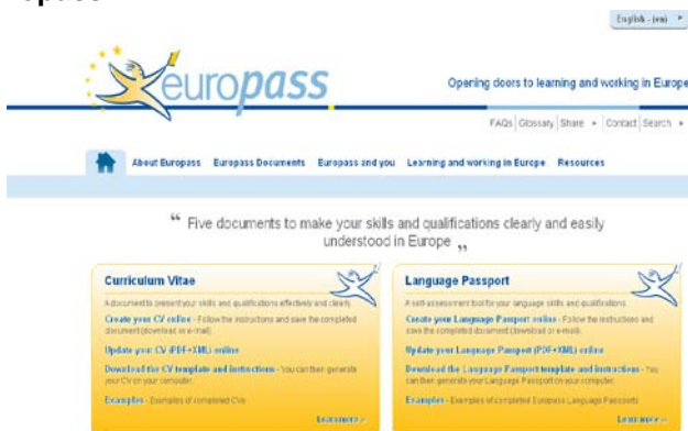
Rysunek 2: Nowa oprawa graficzna serwisu Europass

Od ponad siedmiu lat, łatwy dostęp stanowi o sukcesie dokumentów Europass. W grudniu 2011 r. zmieniono oprawę graficzną serwisu, co jeszcze bardziej zwiększyło dostępność informacji (Rysunek 2). Do końca 2012 r. w serwisie internetowym Europass zostanie zamieszczony nowy formularz CV. Nowa strona internetowa Europass będzie lepiej współpracować z innymi portalami, co na przykład ułatwi zapisywanie Europass CV w serwisach rekrutacyjnych.